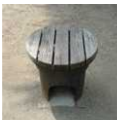
防災用カマド型ベンチ ツール