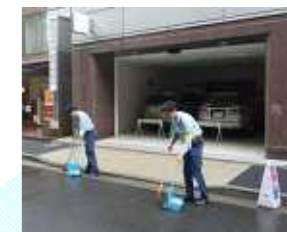
ゴミで多いのは煙草の吸殻です。