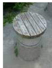
仮設トイレ用ス ツール